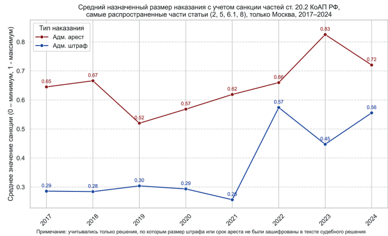
Изображение 3. Средние размеры наказаний (нормализованные) по ст. 20.2 КоАП РФ, Москва, 2017–2024 гг. Picture 3. Average penalties (normalized) under Article 20.2 of the Code of Administrative Offenses of the Russian Federation in Moscow from 2017 to 2024.