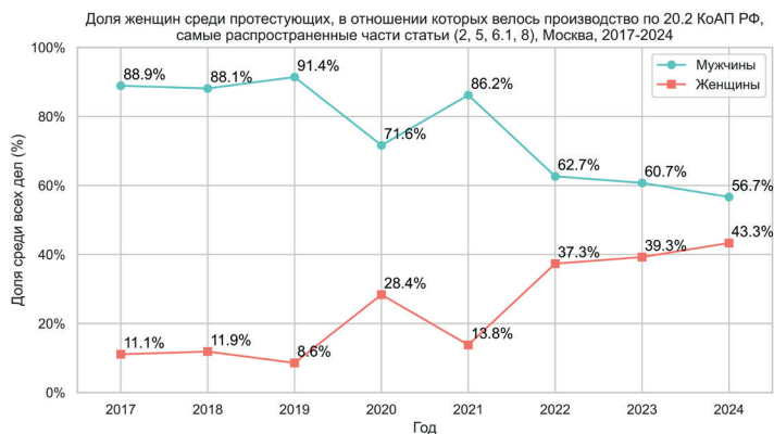
Изображение 1. Доля мужчин и женщин среди протестующих, в отношении которых велось производство по ст. 20.2 КоАП РФ Picture 1. The proportion of men and women among protesters who were prosecuted under Article 20.2 of the Code of Administrative Offenses of the Russian Federation