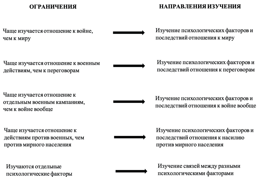
Рисунок 2. Ограничения и направления будущих исследований Figure 2. Limitations and directions for future research

Во-вторых, для разрешения международных конфликтов люди используют как военные действия, так и переговоры. Проведение переговоров — это популярная тема психологических исследований. Однако ученые фокусируются на поведении участников, а не на отношении наблюдателей, в данном случае — граждан, которые могут одобрять или не одобрять этот способ решения международных конфликтов. Как следствие, мы имеем представление о факторах и последствиях отношения к войне, но практически ничего не знаем о факторах и последствиях отношения к переговорам.