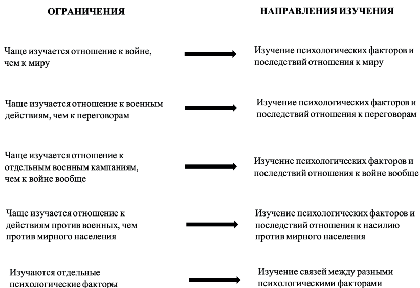
Рисунок 2. Ограничения и направления будущих исследований Figure 2. Limitations and directions for future research

Во-вторых, для разрешения международных конфликтов люди используют как военные действия, так и переговоры. Проведение переговоров — это популярная тема психологических исследований. Однако ученые фокусируются на поведении участников, а не на отношении наблюдателей, в данном случае — граждан, которые могут одобрять или не одобрять этот способ решения международных конфликтов. Как следствие, мы имеем представление о факторах и последствиях отношения к войне, но практически ничего не знаем о факторах и последствиях отношения к переговорам.